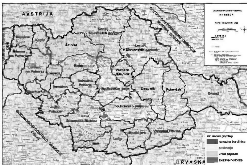
Slika 4: Pregledna karta lokacij pojavljanja ITV po revirjih v GGO Maribor (vir: revirni gozdarji).

Revirna gozdarja v revirjih Spodnje Dravsko polje in Rače sta povedala, da je razširjenost navadne barvilnice v teh revirjih takšna, da beleženje posameznih lokacij ni več smiselno, kar je razlog, da znotraj teh revirjev ni zabeleženih konkretnih lokacij.