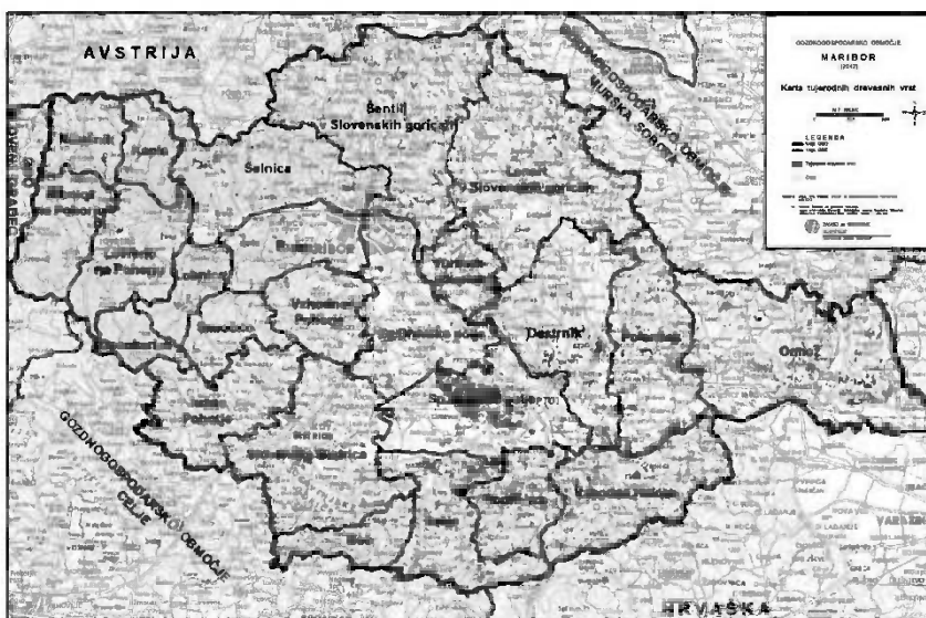
Slika 2: Pregledna karta prisotnosti tujerodnih drevesnih vrst v GGO Maribor.

( Robinia pseudacacia L.). Od tujerodnih drevesnih vrst se na GGO Maribor v drevesni sestavi najboljše pojavlja navadna robinija ( Robinia pseudacacia L.), sledijo ji zeleni bor ( Pinus strobus L.), duglazija ( Pseudotsuga menziesii (Mirbel) Franco) in rdeči hrast ( Quercus rubra L.) (slika 2.1) (ZGS, 2013). Vse naštetje drevesne vrste se v naravi tudi uspešno naravno pomlajujejo. Zlasti svoj areal vztrajno širi navadna robinija ( Robinia pseudacacia L.). Duglazija ( Pseudotsuga menziesii (Mirbel) Franco) in rdeči hrast ( Quercus rubra L.) sta omejena le na manjši areal okrog nasadov. Navadna robinija ( Robinia pseudacacia L.) se širi predvsem ob železniških progah v gozdovih ob reki Dravi, v sestojnih vrzelih v nižinskih gozdovih (Dravsko in Ptujsko polje) ter v gozdovih gričevnatega sveta (Slovenske gorice in Haloze).