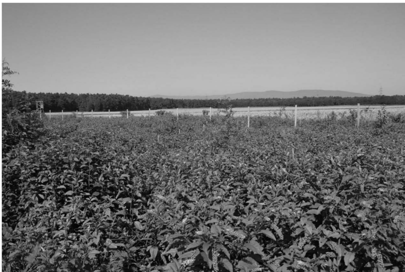
Slika 7: Odsek 33017A (Kungota pri Ptuju): stanje poleti 2017.