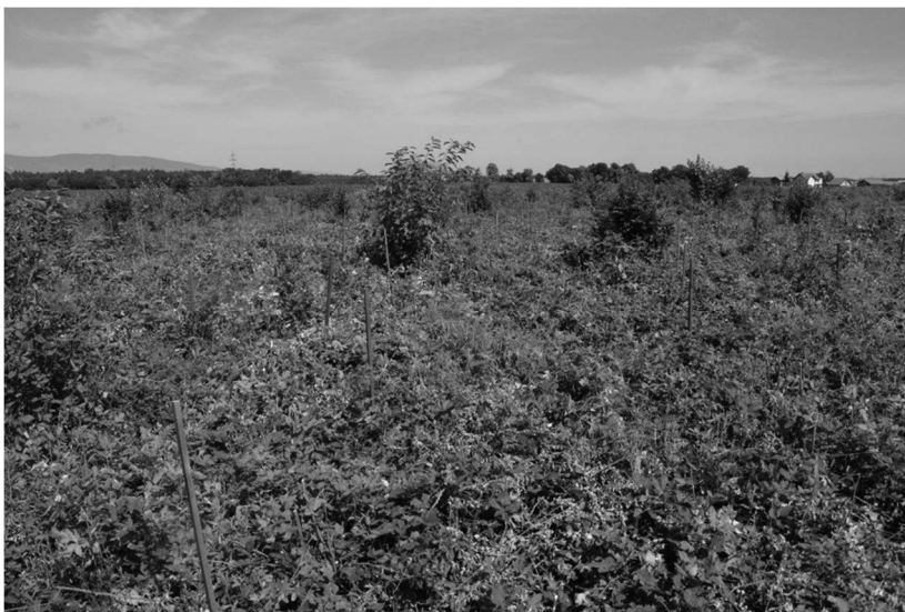
Slika 8: Odsek 33017A (Kungota pri Ptuju): stanje poleti 2018, po treh obžetvah.

Ukrepano tudi v gozdovih, kjer se pojavlja pavlovnija in ponekod tudi veliki pajesen. Tudi tam lastnikom izdajamo odločbe, s katerimi predpišemo izsek vseh osebkov pavlovnije in velikega pajesena. Takšen primer je gozd v Žerovincih v GGE Ormož,