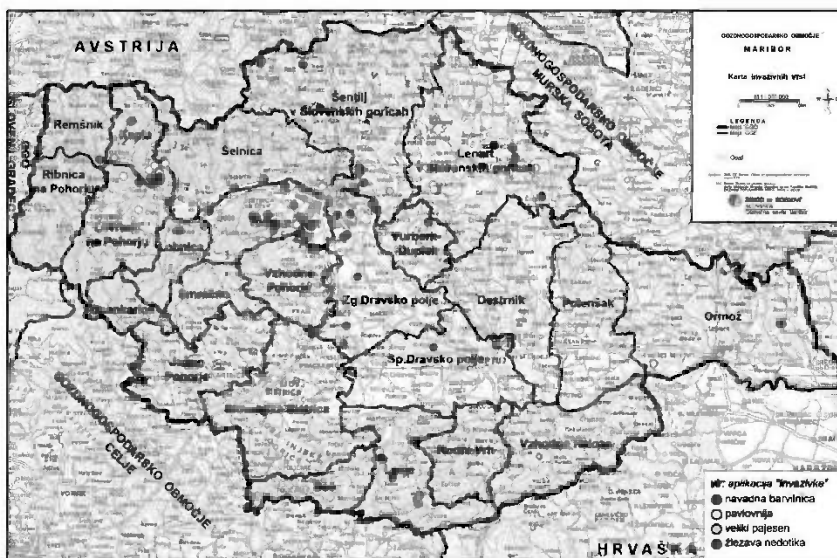
Slika 3: Pregledna karta pojavljanja obravnavanih ITV v GGO Maribor.

V nadaljevanju prispevka se ukvarjamo samo s štirimi rastlinskimi invazivnimi vrstami (rumeno obarvane), za katere ocenjujemo, da že predstavljajo gozdnogojitveni problem.