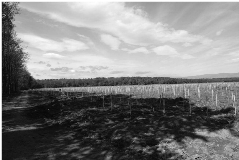
Slika 6: Odsek 33017A (Kungota pri Ptuj): sadnja pomladi 2017.

V teh gozdovih je navadna barvilnica zelo agresivna, vendar opažamo, da se pokrovnost barvilnice po vsaki obžetvi nekoliko zmanjša.