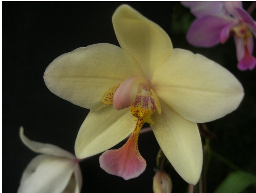
Photo 1. Spathoglottis 'Memoria Aide Alonso'

Terrestrial, robust grass of 0.50-0.70 m including the floral scape. Ovoid pseudobulbs of green color. Leaves lanceolate, of 3-5 by pseudobulbs. Floral cylindrical scape, up to two per bulb, 0.40-0.50 m long, erect, distal part bracteate, bracts elliptical to oval, greenish pink, with a single flower in the armpit. Floral buttons greenish yellow with pink betas (Photo 1). Flowers of 7 cm of diameter, petals and sepals of yellow color becoming of creamy color during the days. Lip trilobulate, lateral lobes suborbicular yellow with reddish spots, stipulated central lobe of pink coloration with two erect callosities at the base of the yellow stipe. Column 1.8-2.0 cm yellow with pink tip. Fruits of greenish coloration.