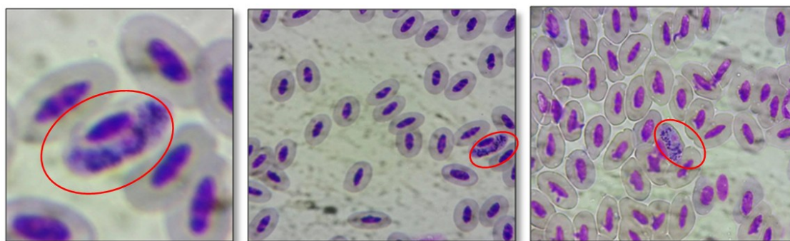
Figure 5 : Aspect d' Hoemoproteus sp. vu au microscope optique (G.×100)