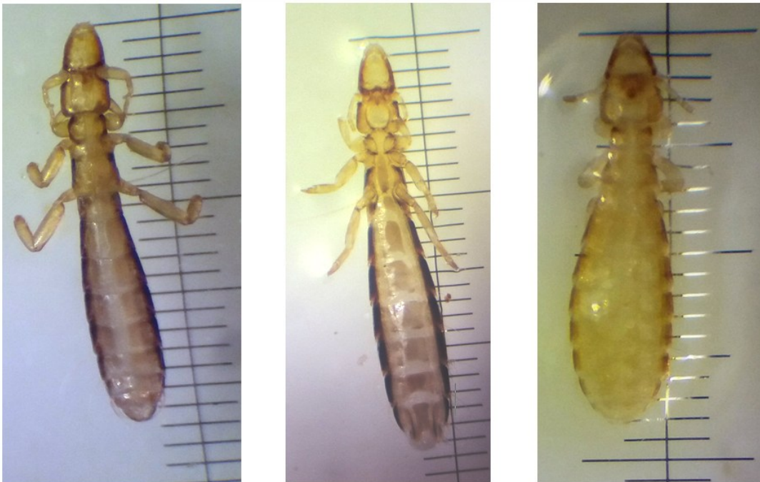
Figure 2 : Columbicola columbae observée sous loupe binoculaire (G. \times 4,5 ) ♂ (à gauche), ♀ (au milieu) et nymphe (à droite) (Marniche, 2017)

Egalement nous signalons la présence de la mouche araignée Pseudolynchia canariensis un diptère qui appartient à la famille des Hippoboscidae collectés sur un pigeon biset (Fig. 3, Tableau 1).