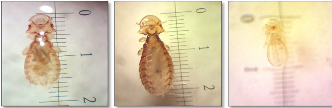
Figure 1 : Campanulotes compar observée sous loupe binoculaire \times 4,5 ♂ (à gauche), ♀ (au milieu) et nymphe (à droite) (Marniche, 2017)