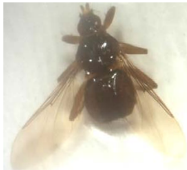
Figure 3 : Pseudolynchia canariensis observé sous loupe binoculaire (G. \times 4,5 ) (Messaoudi, 2017).

Egalement nous signalons la présence de la mouche araignée Pseudolynchia canariensis un diptère qui appartient à la famille des Hippoboscidae collectés sur un pigeon biset (Fig. 3, Tableau 1).