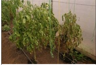
ঢোলপেরা টমটোে (এরকি বোয়োর ঢোলা ছবি)

Ralstonia solanacearum টমটোের ঢোলপেরা রোগ