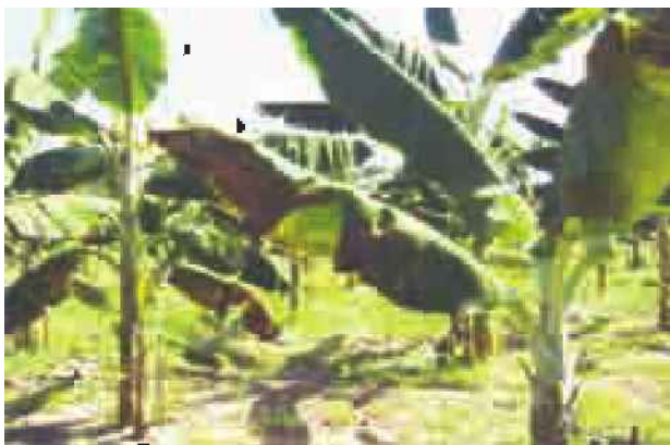
Figura 2 - Bananeiras com sintomas característicos de Sigatoka-negra

Até então, a Sigatoka-negra ainda não havia sido encontrada no Nordeste paraense, ficando restrita às regiões anteriormente citadas. Considera-se que ainda não está disseminada por todo o Estado devido, principalmente, à restrição de trânsito de bananas provenientes de áreas onde a doença já existe.